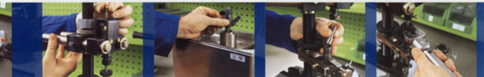
Fachmännische Instandsetzung eines Common Rail Injektors