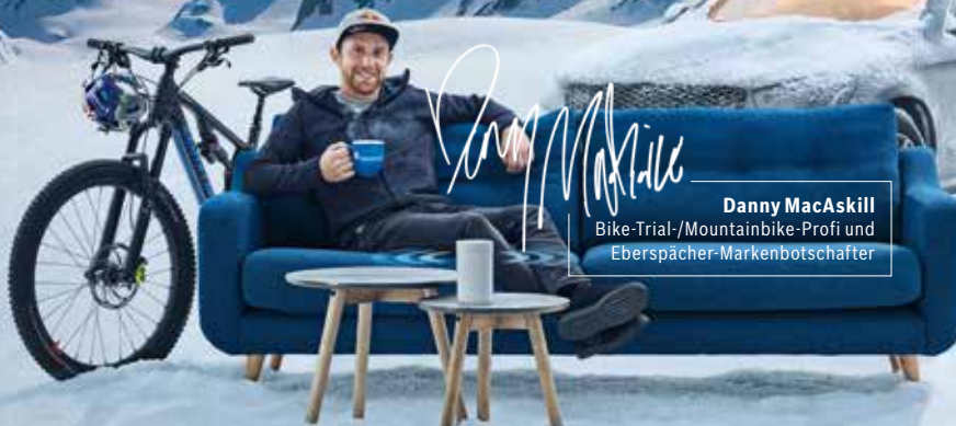
Danny MacAskill Bike-Trial-/Mountainbike-Profi und Eberspächer-Markenbotschafter